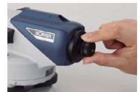
40x 接眼レンズ EL5 (B2o)

望遠鏡に光学マイクロメーターを取り付けることにより0.1mmまで高さを読むことが可能となります。精密水準測量、工作機械の据付等、高精度が要求される作業に活用いただけます。