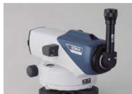
ダイアゴナルアイピース DE16 (B2o)

接眼部に取付けることにより、90度方向からのぞくことができます。低位置での観測や、狭い場所での観測に便利です。