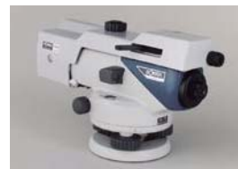
光学マイクロメーター OM5 (B2o)

接眼部に取付けることにより、90度方向からのぞくことができます。低位置での観測や、狭い場所での観測に便利です。